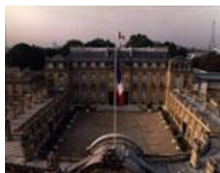
l'Élysée (le palais présidentiel)

Voir son serveur: La Présidence de la République